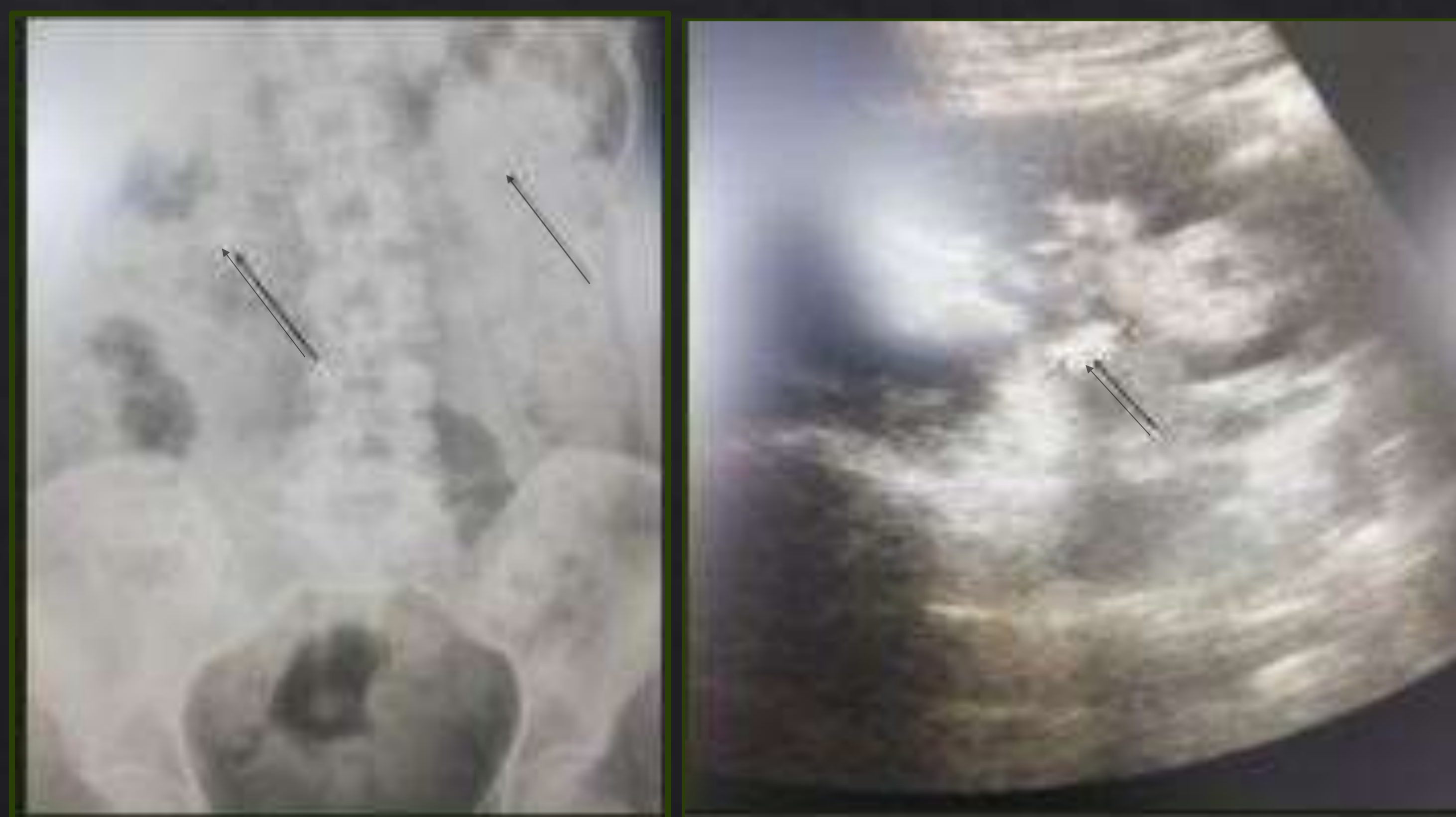
Litiasis derecha 13 mm en UPU Litiasis izquierda 6-8 mm en polo superior

CÓLICO SÉPTICO POR LITIASIS OBSTRUCTIVA DERECHA Y ECTASIA II